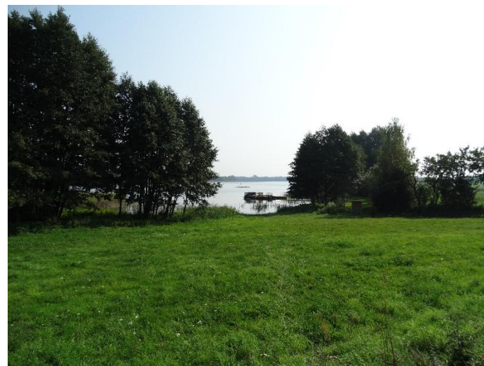
Foto: Jezioro Sławianowskie w Buntowie