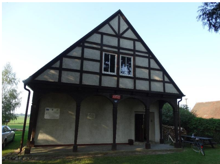
Foto: Świetlica wiejska w Buntowie